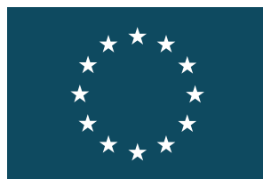
EURÓPAI UNIÓ (EU) EUROPEAN UNION (EU)